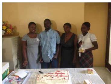
Anniversaires en Janvier

Vous trouverez dans ce numéro, une photo de nos fêtes présents autour de leur gâteau d'anniversaire.