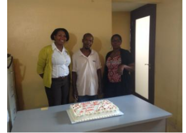
Anniversaires en Février 2014

of Love (ROL) et Hope Home (enfants handicapés) étaient encore à l'honneur. A l'occasion du Carnaval national d'Haïti, nous avons eu la brillante idée de leur apporter une petite ambiance carnavalesque chez eux. Ce qu'ils ont adoré. Ils ont dansé sur les airs de meringues carnavalesques de nos groupes musicaux les plus populaires. Ils ont tous mangé leurs beignets (crêpe typique haïtienne à base de figue préparée pour la saison carnavalesque).